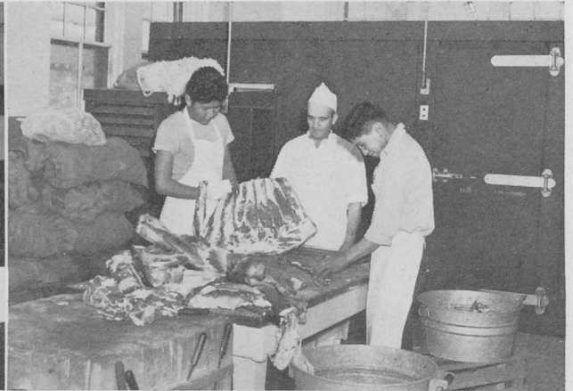
'Ashiiké dóó 'at'ééké da'ólta'' jii t'áadoo la'é náásgóó hanaanish danilji dooleetii la'i 'at'aa 'ádaat'éego bídahojii' aah.