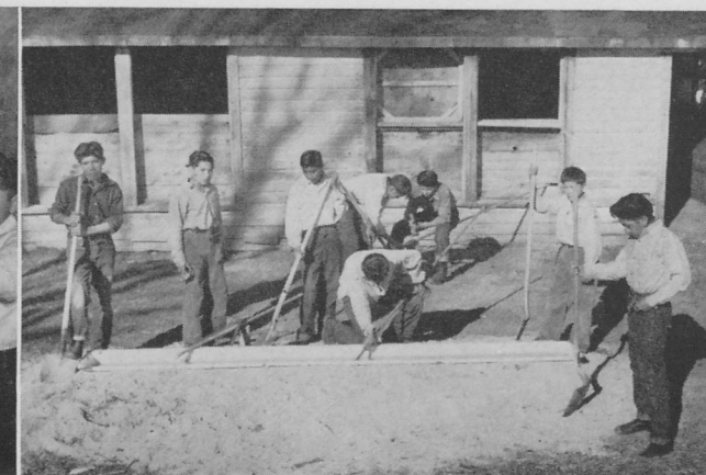
'Ashiiké t'ah 'ániid ndaakai ndi t'áá 'altso naanish náásgóó yee 'ák'indadikai dooleetii yídahoo' aah.