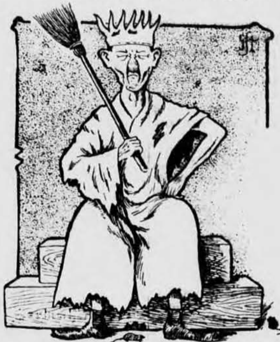
Pač prava spaka!