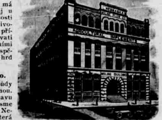
Největší železářský obchod.

tato jest veskerý přízně obecenstva hodna, neboť dovede oceniti práci, jakož i životní potřeby svých podřízených řemeslníků. Když minulý jaro firma tato seznala, že poměry jí to dovolují, zvýšila mzdu všem dělníkům v jejich tovarně zaměstnaným a síce učinila tak bez všeho doprosování. V tovarně této netřeba nikdy zaměstnaným stávkovati za účelem docílení vyšší mzdy. Obchodvedoucí firmy této jest obchodník praktický, jenž z mnohaleté zkušenosti seznal, že nejlepší se vyplácí budovati stroje hospodářské jen z nejlepšího materiálu, tak aby byly nejenom pevné a vytrvalé, ale aby též vynikaly veskerými možnými výhodami nad jiné. Každý farmář, který potřebuje potní stroj, udělá