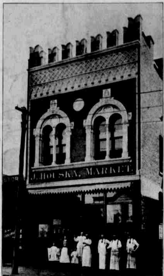
Největší železářský obchod.

Bez pluhu obdělávání půdy jest věc takřka nemožnou. Když navštívili jsme výstavu zamississippišskou, byli jsme zvláště upoutáni výstavkou Nebraska Moline Plow Co., kteráž zde pluhu, vyráběné společnosti toutž, má ve výstavě souladu vystavěné. Popřejete-li výstavce této trochu pozornosti, uvidíte tu pluh jízdní, dvoukolový (sulky) v ceně $15.00, hned vedle opat onen věhlasný a všeobecně oblíbený víceřadličník (Moline Gang Plow) v ceně $500. Vedle téhož i téže výstavce vidíme jejich veskerými přednostmi se honosící sazečku kukuřice v ceně $350. Veskeré v této výstavce ku zvláštěmu prohlednutí a posouzení farmářů rozestavené stroje jsou skutečnými výtvoři dokonlosti a není divu, že zaujmají jejich polní stroje v trhu místo první. A to jest zcela přirozeným, neboť Moline Plow Co., v Moline, Ill., jest jednou z nejstarších a nejovověčenějších továren v této zemi, pak-li ne dokonce na celém světě. Továrna Moline Plow Co. zaměstnává jen ty nejzkušenější a nej-