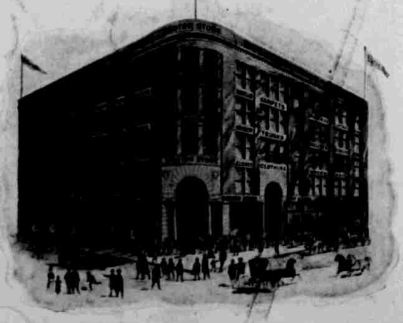
Největší železářský obchod.

ha Brewing Association vařeně. Při českém dni, když na zamississippišské výstavě české sbory a celý průvod se zastaví a vystáviteli se rozjede, zajisté každý bude toužiti po oči, když po osvícení a tu nejlepe učiní, když vyhledá místa, kde pivo Omaha Brewing Ass'n jest čepováno. Nuž a ta místa naleznete, když vyhledáte Market Catering Co., aneb na Midway v české hospodě našeho krajana p. Stillera, aneb v místnostech po obou stranách viaduktu. Vůbec, necht' za vašeho pobytu v Omaze jste již kdekoliv, budete opatrní, omaze pili pivo, po jakém ani žaludek, ani hlava žádných nesnáží a bolestí neutrpí a když přiděříte se výhledně Omaha Brewing Ass'n piva, můžete být bezpečni, že zůstanete - ba i nabydte duševní i tělesné svěžesti. Jak výše jsme již uvedli, lepšího moku, než jakýž pivovarem Omaha Brewing Association vařen jest, dostati nemůžete a proto také radíme Vám, byste jiného piva nepili.