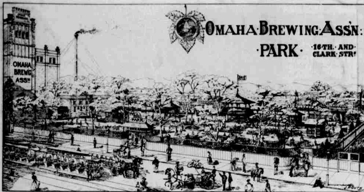
Park omazského pivovaru.

Nejtátnějším místem bez odporu jest park omazského pivovaru, nalézající se na Sherman Avenue naproti Clark ulici, přímo jižně od pivovaru. Místo toto jest takřka stvořeno pro pohov, odpočinek a občerstvení. Vysoké kešaté stromy poskytují hustý stín a libý chlad v parném deně, u večer pak otevřená poloha umožňuje věnek, necht' ze strany kterkolivěk, tak že pobyt v tomto útulku jest právě tak rozkošným za dne, jako u večer. Park tento rozkládá se na výšině, která vrbouí údolí a bývalé řečiště řeky Missouri a vyhlídka, která se tu naskytuje, jest skutečně čarovná. Pod námi šíří se do nekonečné dálky údolí k severu i jihu, v smaragdové zeleni se skvoucí. Za nížními na východ zvedají se do značné výše stráně ohraňující iouské břehy Missouri. K jihovýchodu leskne se zčeřená hladina mocné Missouri, rmutné vlny své rychle ku gulfu valící. Za ní pozor-