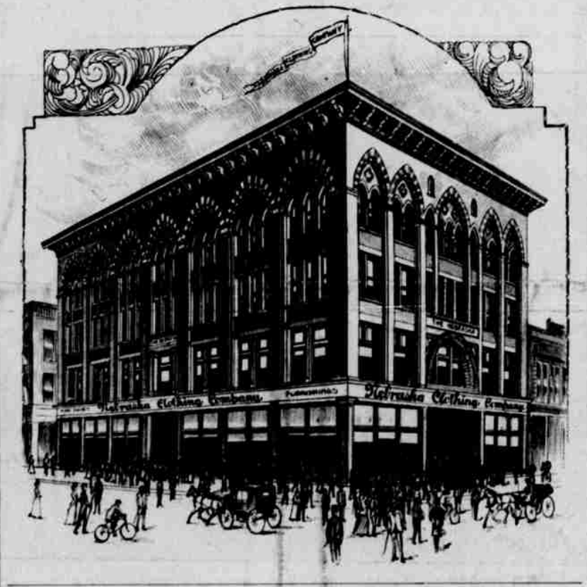
Nejstarší omazský pivovar.

Jak z vyobrazení viděti, jest budova, v které nalezá se Nebraska Clothing Company, jednou z nejúhlednějších obchodních budov v Omaze. Byla postavena roku 1897 a jest tedy úplně novou. Zaujímá 137 stop na patnácti ulici a průčelí její na Farnam nejlépejšího obchodního ulici města, má šířku 77 stop. Zbudována jest z cihel světlých, ve síluh katedrálím a byla zvláště zbudována pro potřebu největšího obchodu se šatstvem, kterýž zaujímá budovu celou od sklepa, až po střeš. Prostora všech poschodí za ujmě skoro pět akrů a veschry obchodní místnosti mají znamenité světlý z nesčetných oken se dvou stran budovy, kteráž jsou zasklena sklem broušeným. The Nebraska Clothing Company, kteráž zaujímá celou tuto budovu, jest jedním z nejstarších a nejspolehlivějších obchodních závodů v zemi a proniká obchodem svým skoro do všech států a teritorii celé Unie. Všude, kde šatstvo se nosí, známa jest tato firma svými levnými cenami a spolehlivým zbožím a pravé se, že vedouc obchod s 85,000 odběrateli prostřednictvím objevnéku poštou, kterýžto odbor jest velice rozsáhlým. Pan Ant. Novák, jeden z maršálů v průvodu o českém dni, jest již po delší dobu zaměstnán touto firmou co prodává a s potěšením poslouchá krajanům svým.