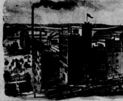
Omaha Brewing Ass'n Pivovar.