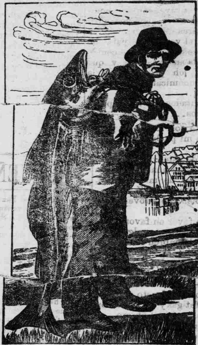
Marca que aparece en cada botella de la legítima.

Las personas tan poco escrupulosas que de tal engaño son capaces, no es extraño que lleven su mala fé más adelante y que según engañan con la cubierta engañen también con el contenido de sus frascos, llenandolos con una sustancia que se asemeje á la famosa y legítima EMULSIÓN de SCOTT, pero que en realidad no es más que un menjurge, que se puede vender muy barato, pero que es caro á cualquier precio. El público debe insistir en que los boticarios le vendan la