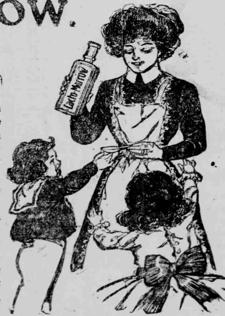
Esos que toman otra Emulsión.