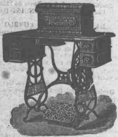
"LA DOMESTICA" PREMIADA EN PARIS-BORDEAUX EN LA EXPOSICION DE 1889 Y EN LA EXPOSICION DE 1893 EN CHICAGO.

A. Besosa & Co. 186 WATER STREET—New-York. Unicos exportadores para PUERTO-RICO.