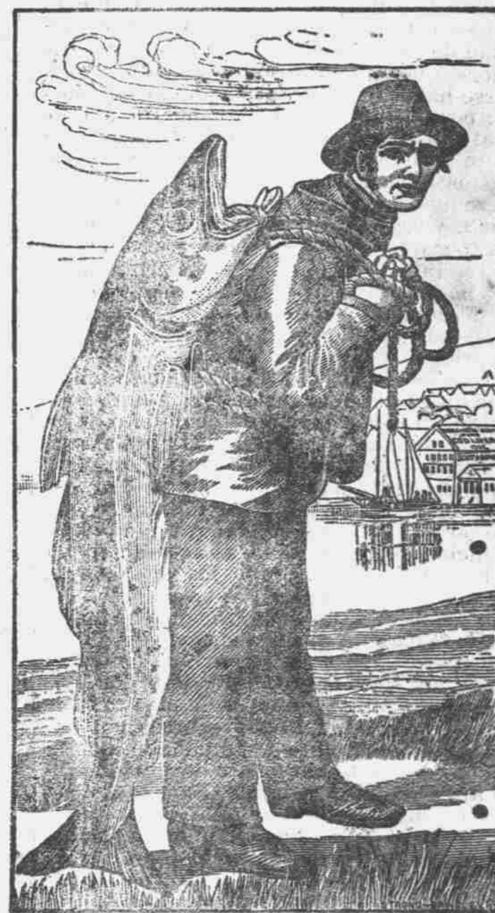
Marca que aparece en cada botella de la legítima.

Las personas tan poco escrupulosas que de tal engaño son capaces, no es extraño que lleven su mala fé más adelante y que según engañan con la cubierta engañen también con el contenido de sus frascos, llenándolos con una sustancia que se asemeje á la famosa y legítima EMULSIÓN de SCOTT, pero que en realidad no es más que un menjurge, que se puede vender muy barato, pero que es caro á cualquier precio. El público debe insistir en que los boticarios le vendan la