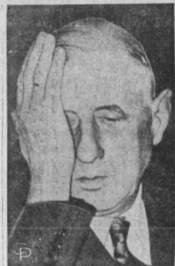
Poza arată cit de vesel e președintele Charles de Gaulle al Franței cu „victoria” obținută.

(Cont. din pag. 3-a) rism? Căpitane, oare nu știi că servești națiunea pentru a-i reda pacea, când a pierdut-o? Oare nu știi cine ești? Dacă e așa fi uitat toate acestea victimele voastre mi le-ar fi amintit. Si voi spune în ce fel. Mă găseam de partea cealaltă a frontierei, cu câteva zile după înfrângerea noastră. Vizităm alte lagăre de refugiați, căci n-ai nimic altceva de văzut când vii în Algeria. O mare frică cuprinsese populația când armata franceză s-a abătut asupra regiunilor în revoltă, semănând groaza în fața ei și moartea în urmă.